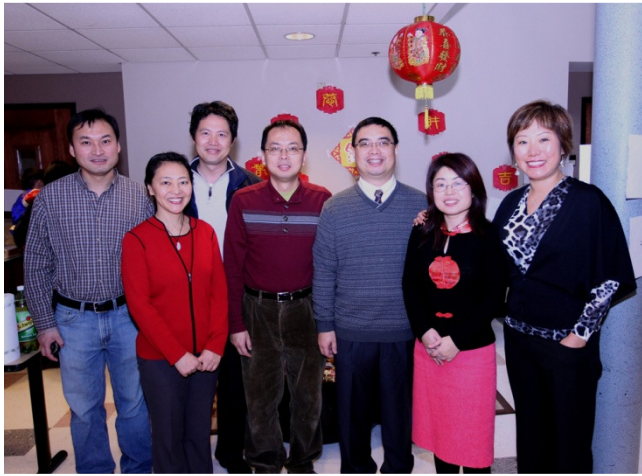
南校校务会和家长会举办新春联欢会

手段，相互学习，更密切和家长的联系，把我校教学工作提高到一个新的水平。严总校长讲话之后，老师们分专题按年级进行了教学讨论。