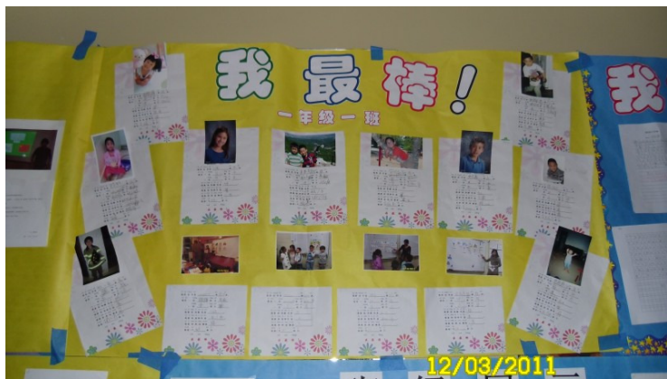
北校一年级一班的学生作业展示