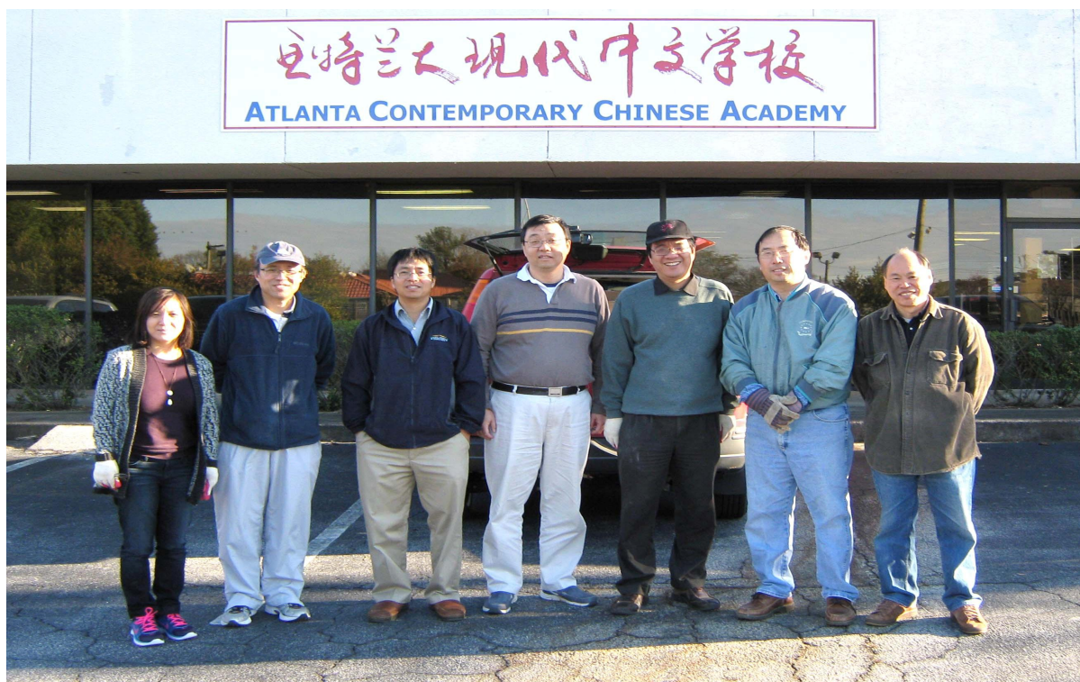
(理事、家长一起动手，为主校园出租做准备。图为参加义务劳动的理事和家长们)