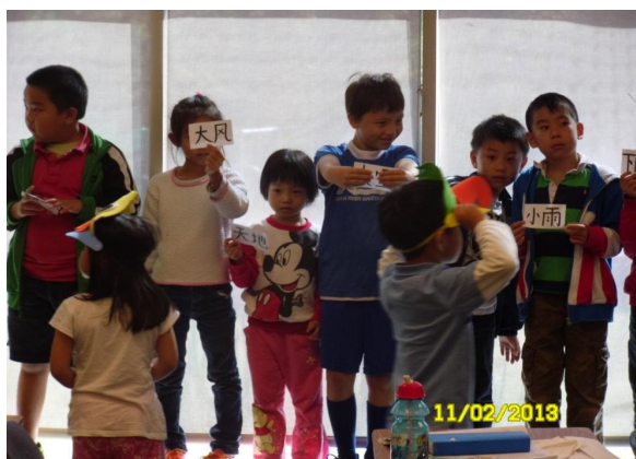
(上图为三年级二班同学分三组在做排字比赛游戏)

使我的中文班变成 ACCA【快乐学中文】特色中文班，愿更多的孩子走进中文学校，走进中文课堂，开始一段长久的、快乐学中文的美好旅程！