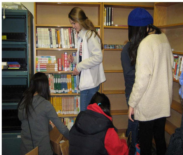
(Duluth High School Beta Club 的同学来帮忙)