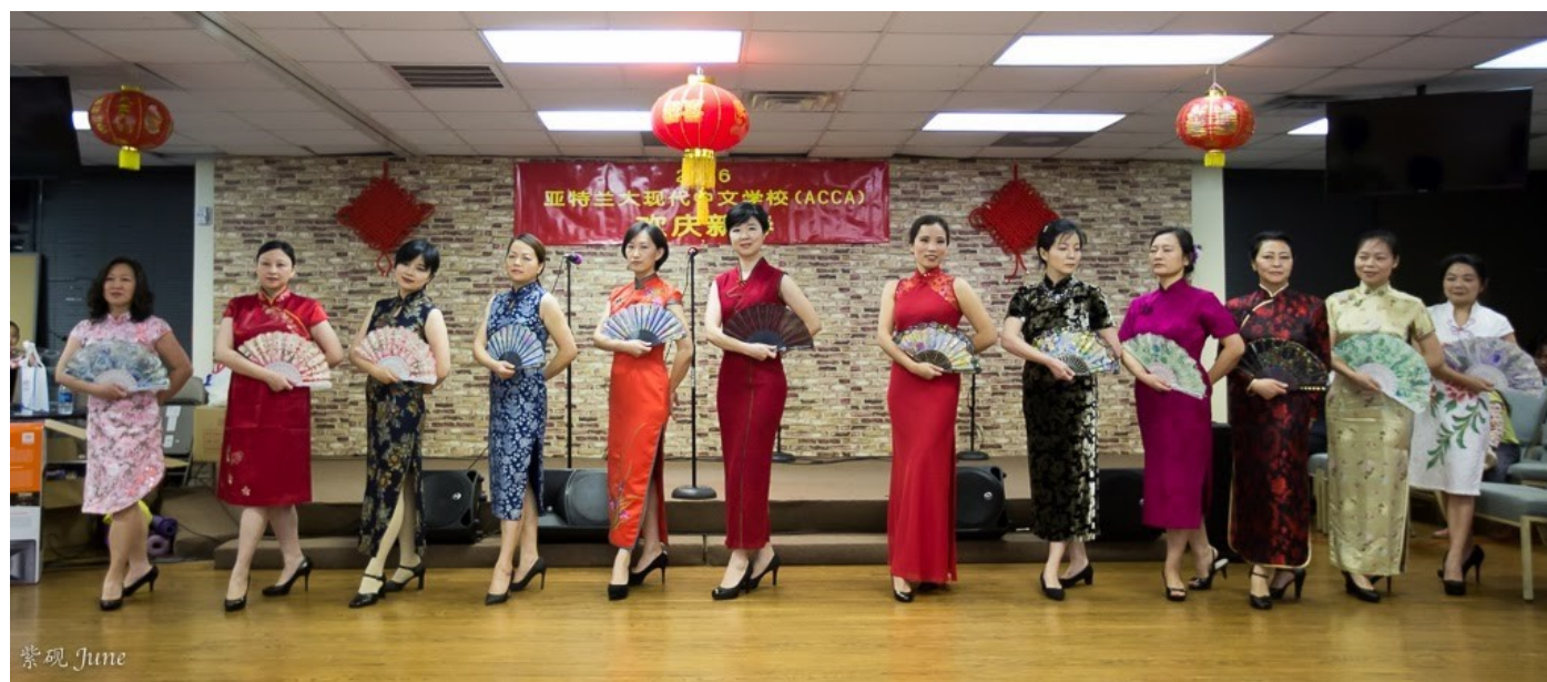
（文：魏玮老师，摄影：石燕平老师）